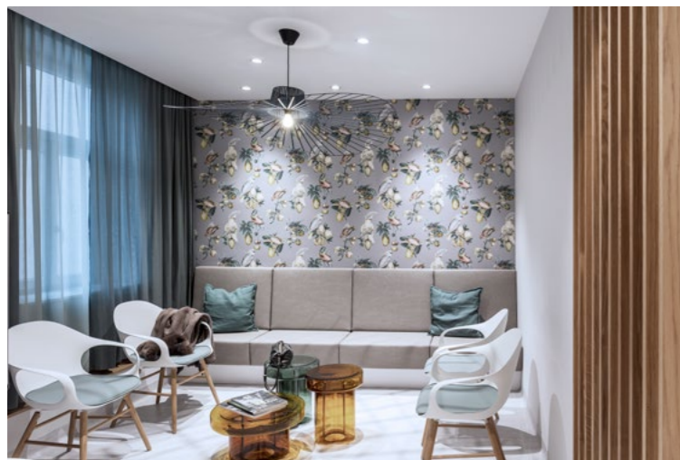
Ärztzentrum Paulus 12, 1120 Wien

Optimale Praxisräumlichkeiten wirken stärkend: Ihre neue Ordination vermittelt Vertrauen und Sicherheit und fördern ein positives Erlebnis.