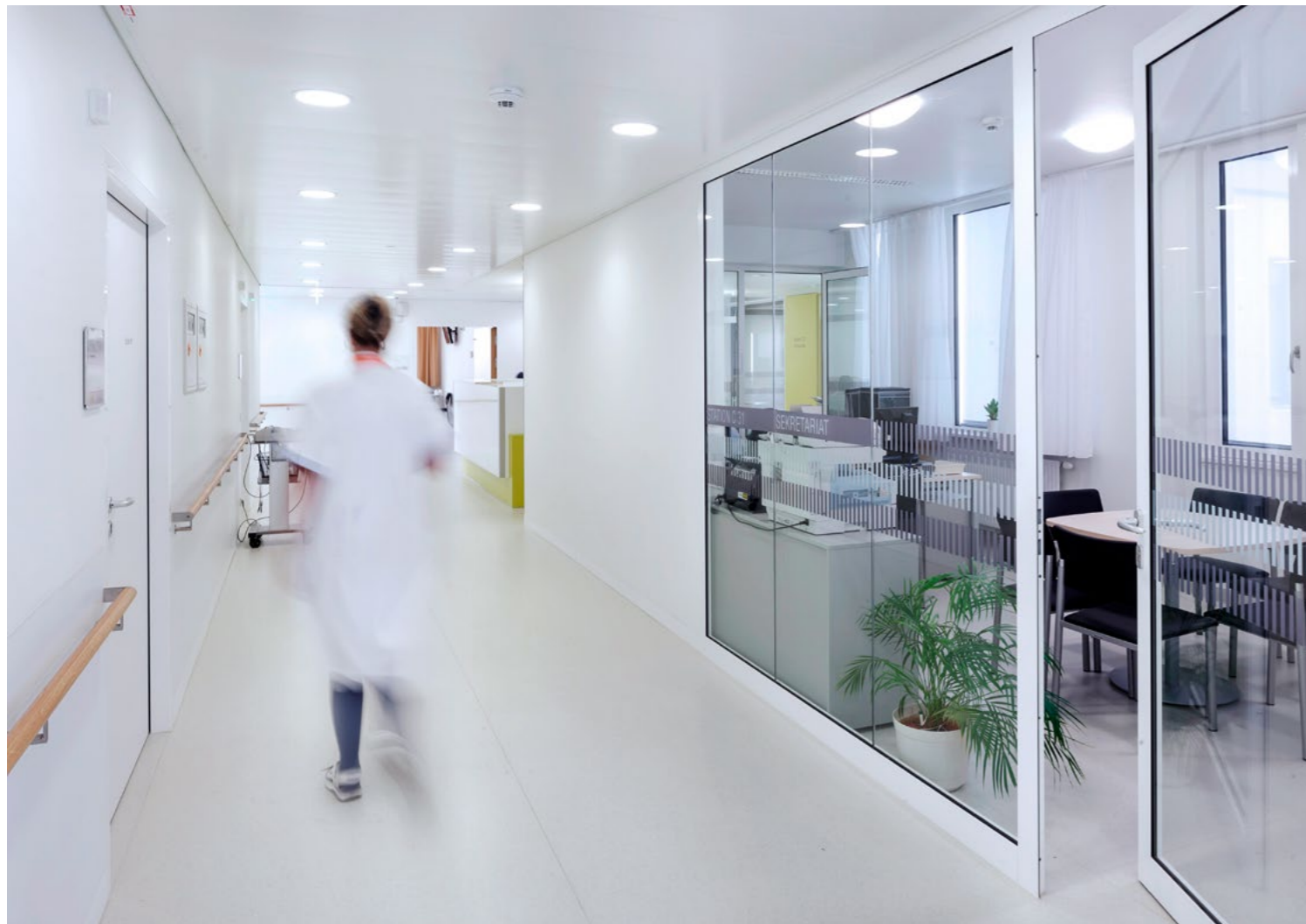
Provisorisches Modulgebäude, Kaiser Franz Josef Spital, 1100 Wien