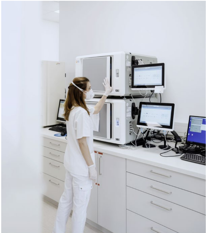
LABCON - Medizinische Laboratorien GmbH 1100 Wien