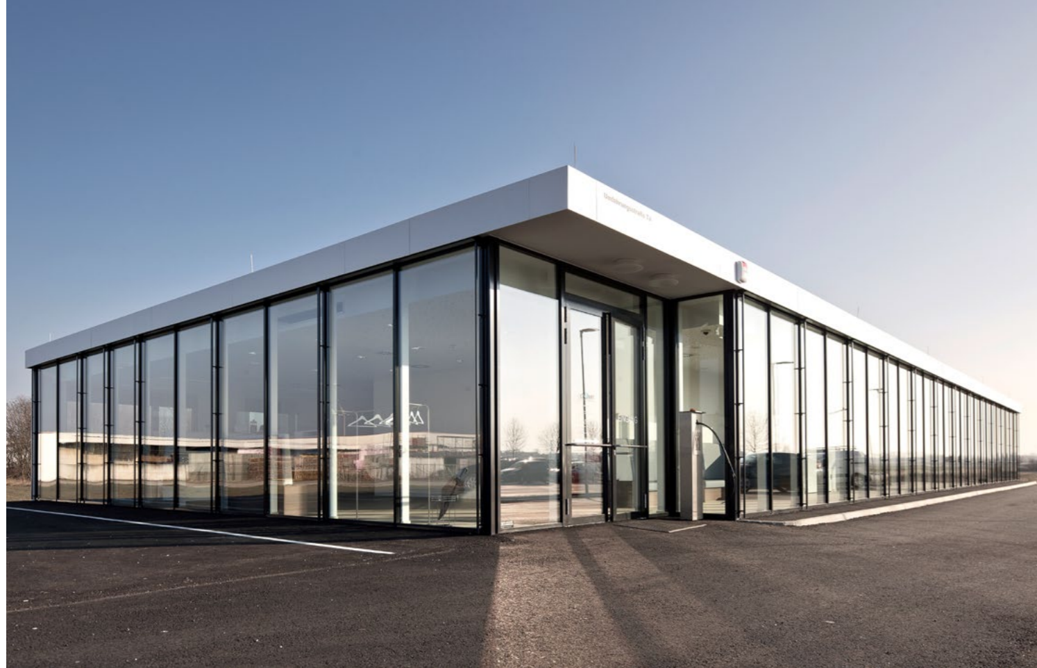
Institut für CT MRT, 2230 Gänserndorf