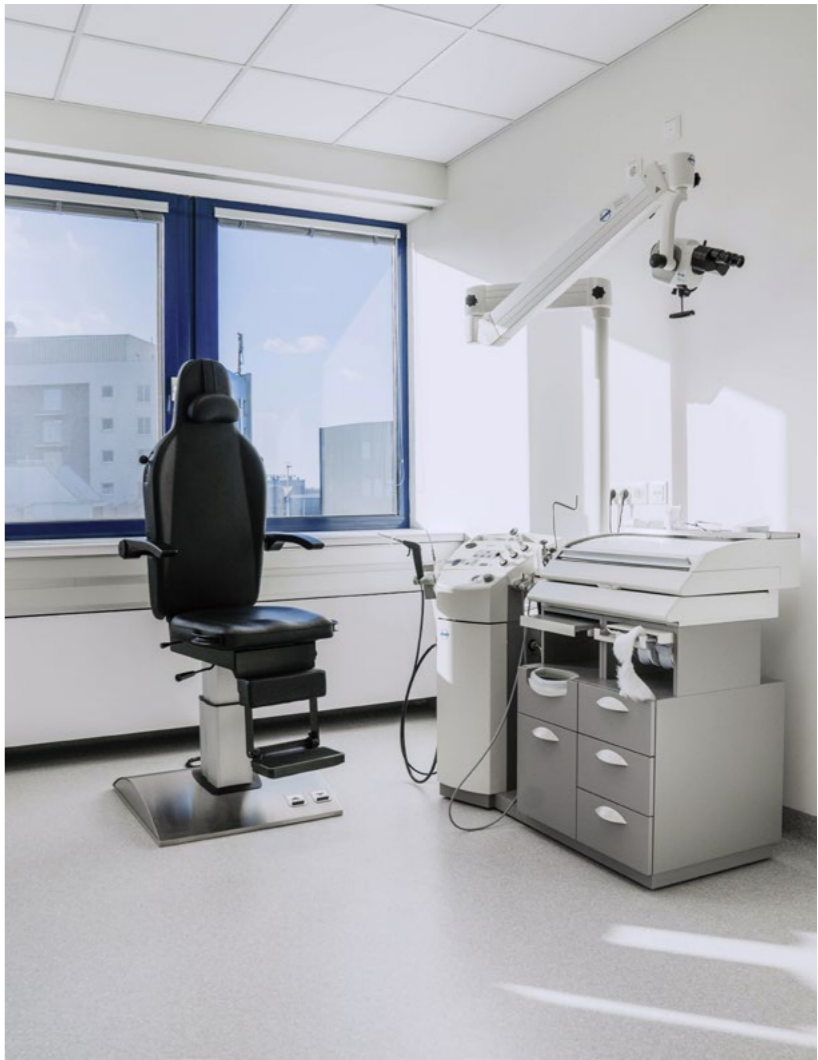
Health Center Vienna Airport 1300 Wien

Wir setzen Ihre Wünsche um und sorgen für mehr Patientenwohl. Aktuelle Angebote finden Sie auf unserer Website!