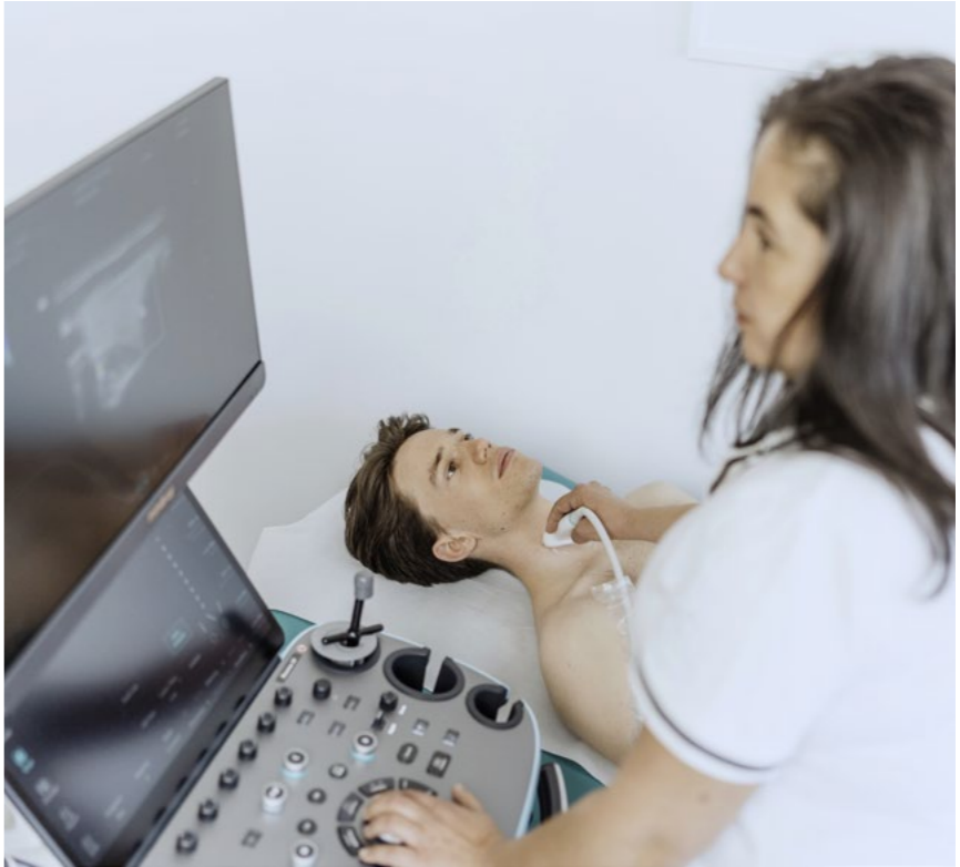
IMED11, 1110 Wien