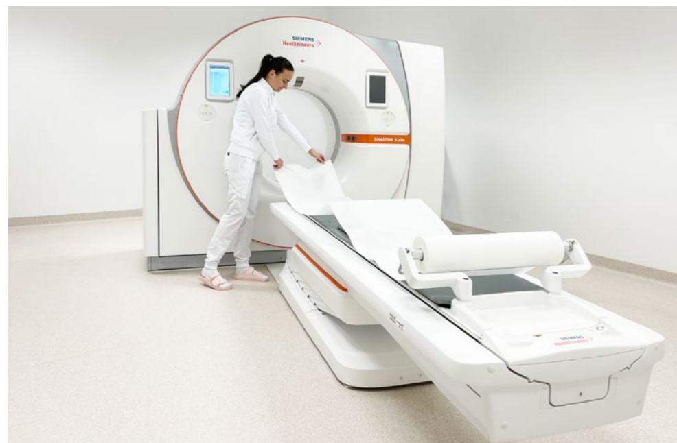
Institut für CT MRT, 2230 Gänserndorf