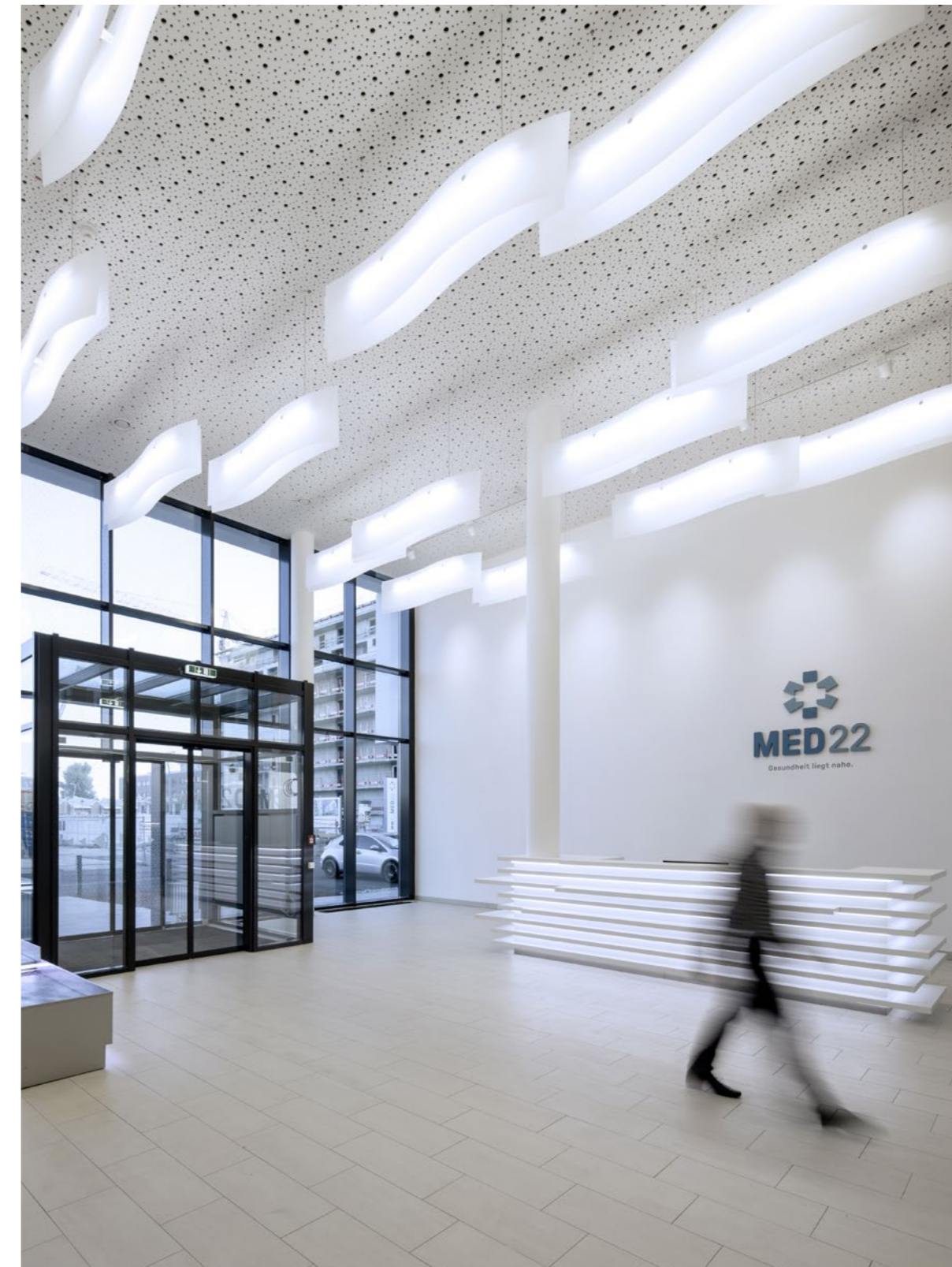
MED22, 1220 Wien