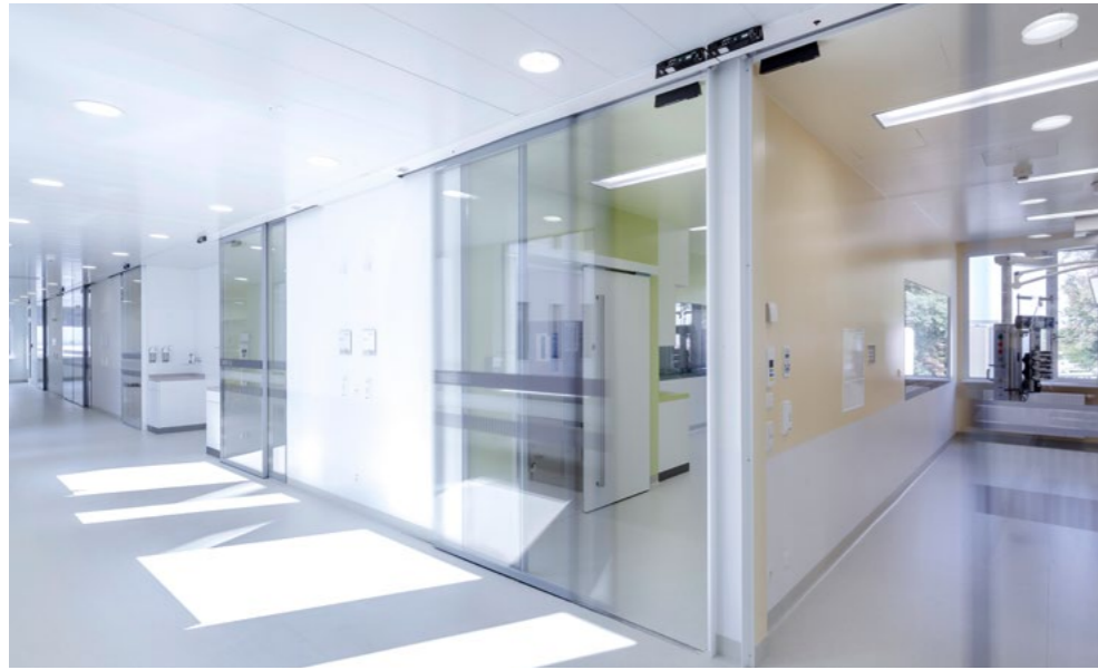
Kaiser Franz Josef Spital, 4. Med. 1100 Wien

Mit Expertise und Innovation schaffen wir komplexe medizinische Raumlösungen.