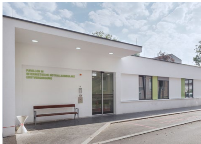
KFJ, Pavillon M Internistische Notfallambulanz, Erstversorgung 1100 Wien

Individuelle Wünsche und zukünftige Entwicklungen – Urbanisierung, demografischer Wandel, Digitalisierung, Klimawandel – nehmen Einfluss auf unsere Planungen.