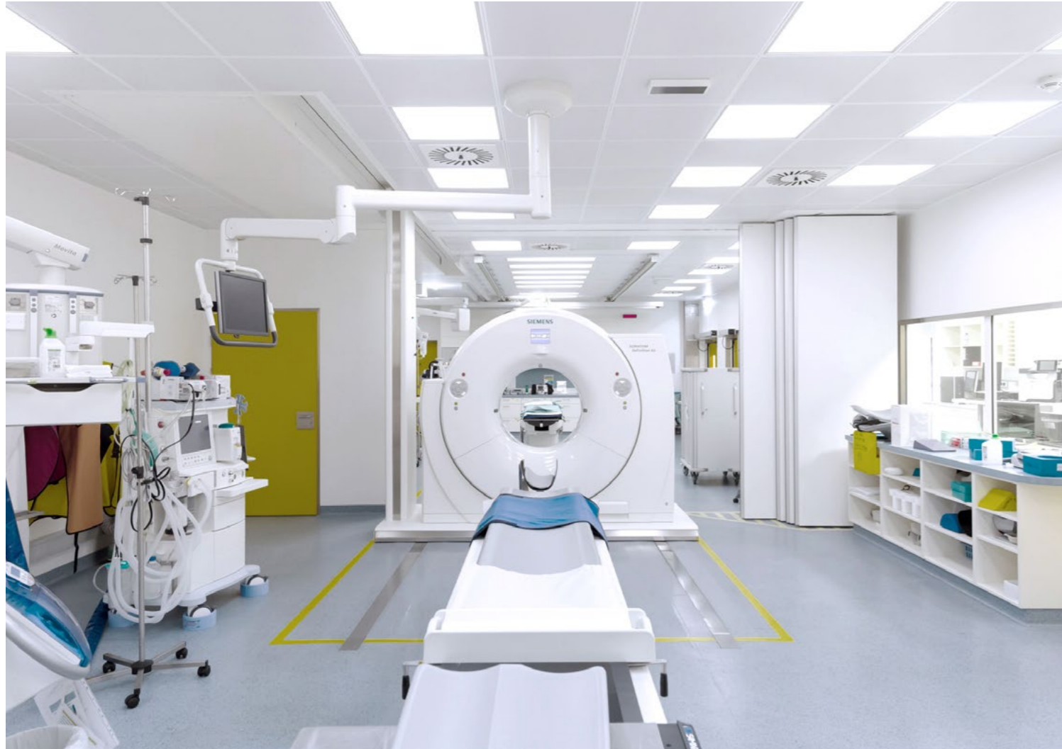
Schockraum Wilhelminenspital, 1160 Wien

Standortsuche / Standortstudien / Immobilienvermietung und -verkauf / Kompetenzbildung Gesundheit / Stadtentwicklung / Standortanalyse