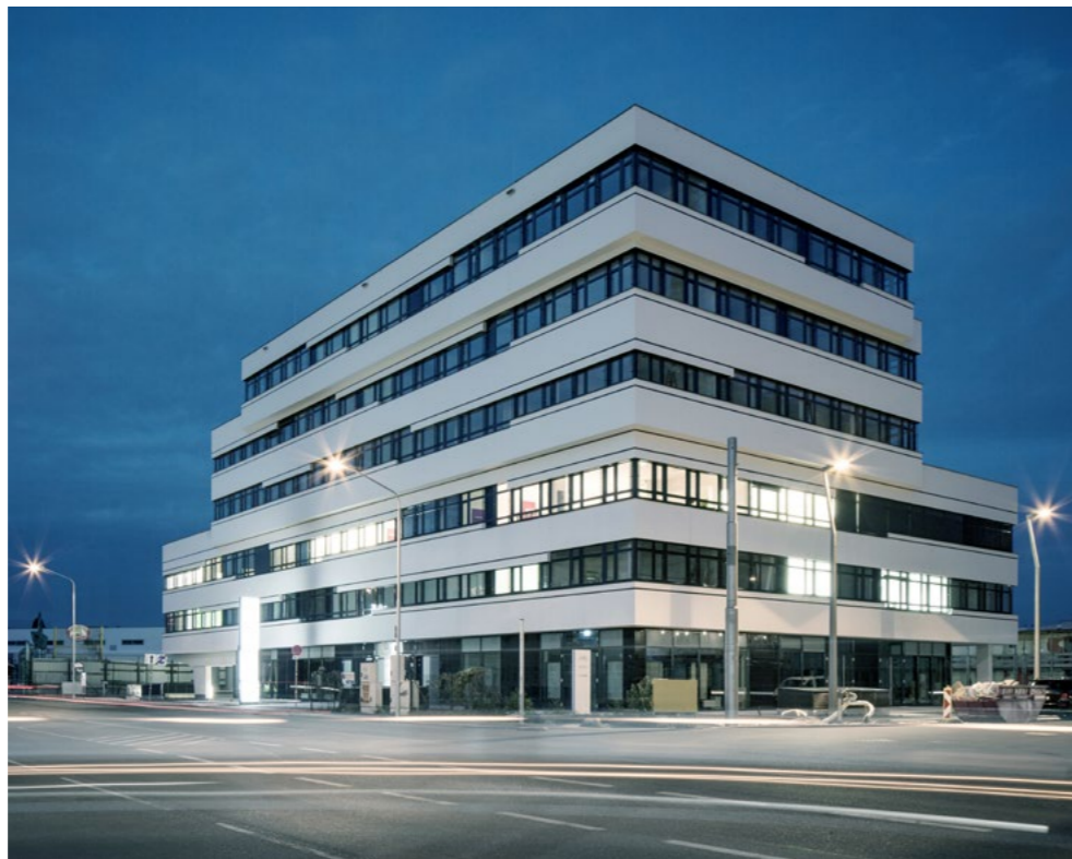
MED22, 1220 Wien