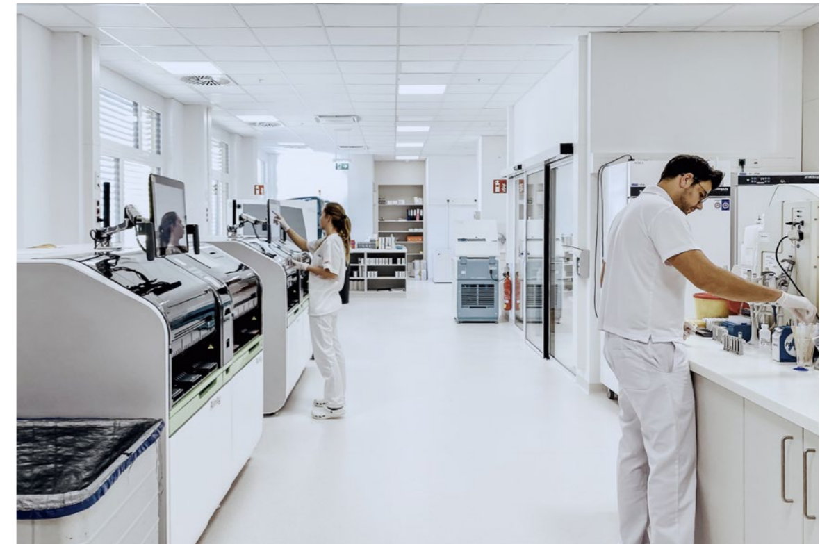
LABCON - Medizinische Laboratorien GmbH, 1100 Wien

Unterschiedliche Anforderungen, spezifische Technik und behördliche Auflagen: Wir planen Ihr individuelles Labor und unterstützen Sie in Sachen Workflow, Behördenauflagen, Labortechnik, Ausstattung, Reinraum etc.