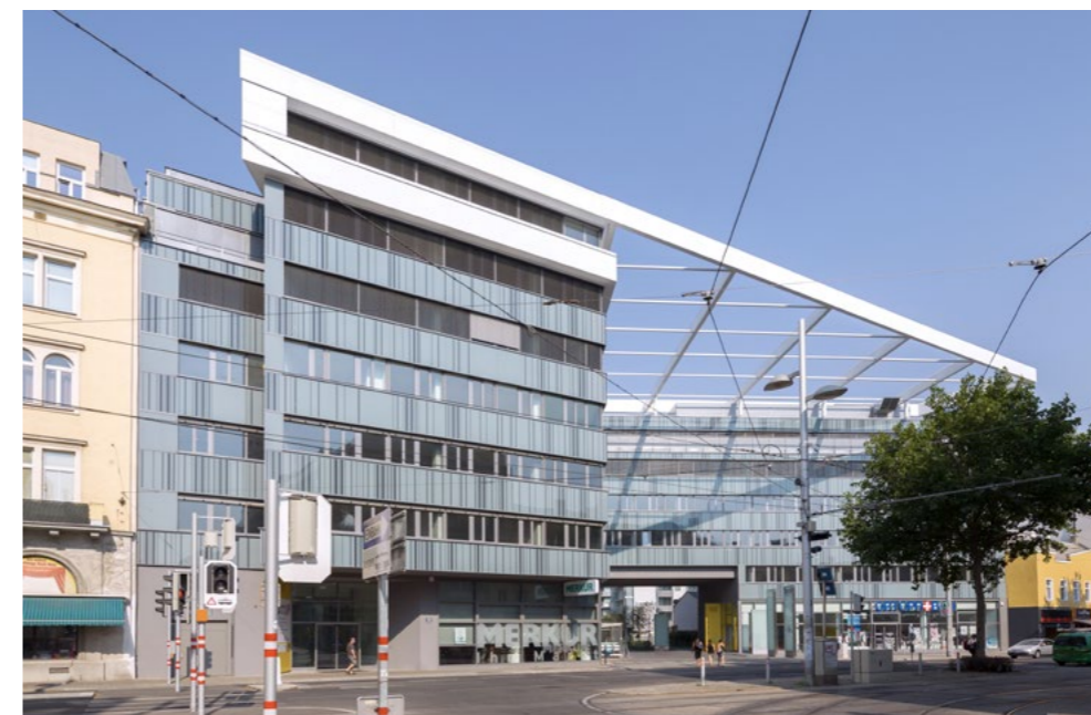
DOC Eleven, 1110 Wien