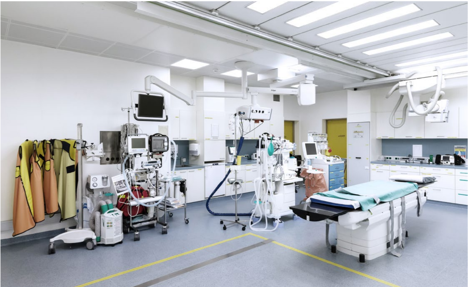
Schockraum im Wilhelminenspital, 1160 Wien

Sicherheit in Ausnahmesituationen. Ganzheitliche Medizin verlangt nach Gesamtlösungen. Als Errichter und Betreiber übernehmen wir die Verantwortung für den gesamten Lebenszyklus Ihrer Gesundheitseinrichtung: modern, mit höchster Arbeitsplatzqualität und Funktion nach den neuesten Hygiene- und Sicherheitsstandards.